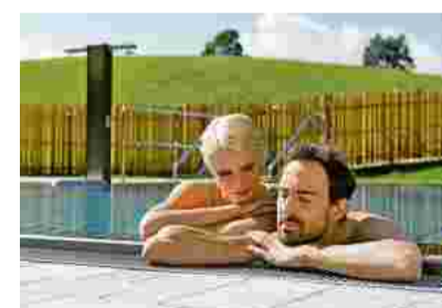
Die Seele baumeln lassen im beheizten Außenschwimmbekken.

einen Erfahrungsschatz von unschätzbarem Wert. Die Ärzte, Diätologen, Physiotherapeuten, Sportwissenschaftler, Therapeuten, Masseur sind hochmotiviert, entwickeln im Schulterschluss innovative Ansätze, tauschen Fachwissen aus und geben es an unsere Gäste weiter.