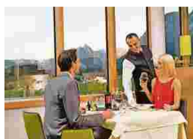
Genießen Sie den herrlichen Ausblick auf die Gipfel der Bergwelt.