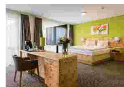
Moderne Suite in der Ausführung Zirbenholz mit Teppichboden