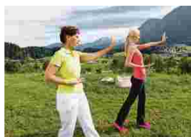
Nehmen Sie teil am kostenlosen Vital- und Aktivprogramm.