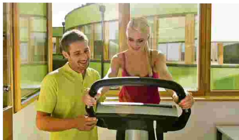
Mit unserem einzigartigen Gesundheitskonzept SiebenMed® steigern Sie Ihr Wohlbefinden nachhaltig.

Unsere Gesundheitsexperten verfügen über hohes Fachwissen und